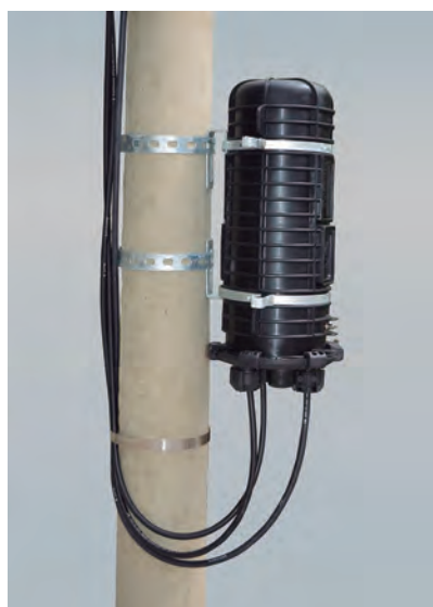
Poste o Pared