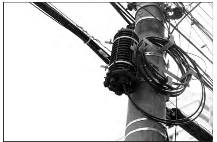
Vista da aplicação do OCRA próxima aos postes.