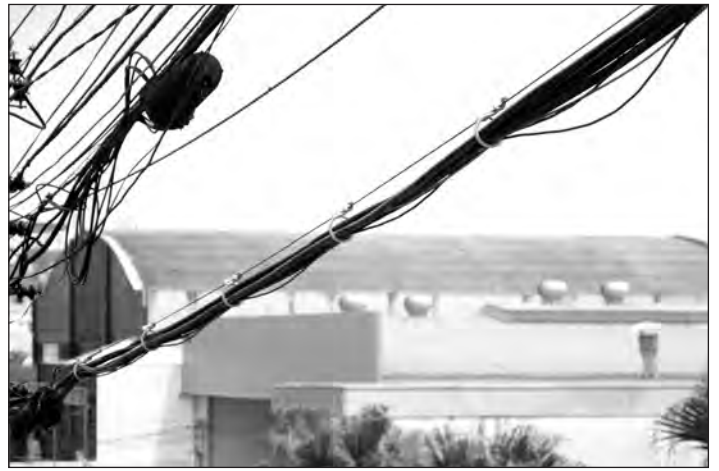
6. Vista da rede aérea organizada com OCRA.