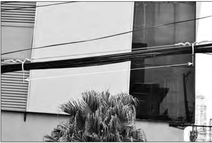
5. Continue a aplicação do OCRA mantendo a distância recomendada na tabela (página 1).