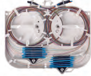
KM 4 24 x 0,25 mm