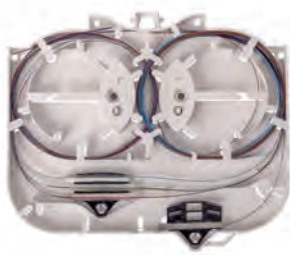
KM 4 3 x ribbon + splitter