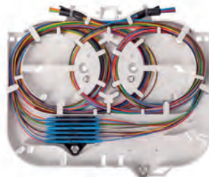
KM 4 12 x 0,9 mm