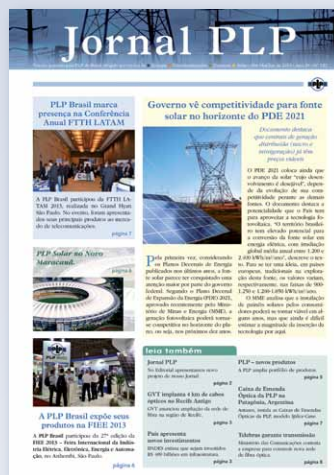
Jornal PLP Novo visual, Edição 142, de 2013