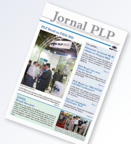
Jornal PLP Edição 141, de 2011